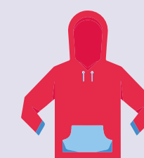
PET "grado fibra" (tessile)

Nel caso del PET (Polietilene Tereftalato) esistono tre tipologie principali: